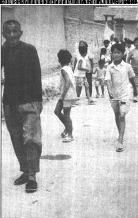
东张村自来水管线铺到家门口